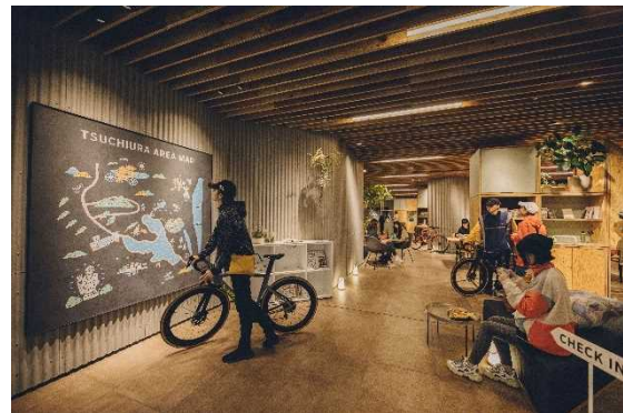
図 7.7 BEB5 土浦