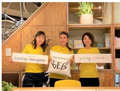
図 7.8 女性やビギナーをターゲットにした情報発信