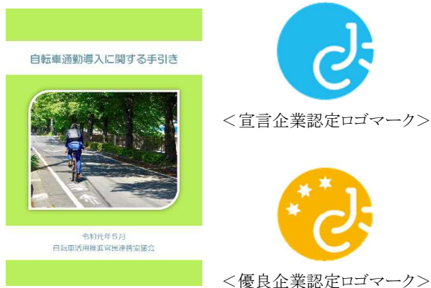
図 7.29 自転車通勤導入に関する手引き （自転車活用推進官民連携協議会）