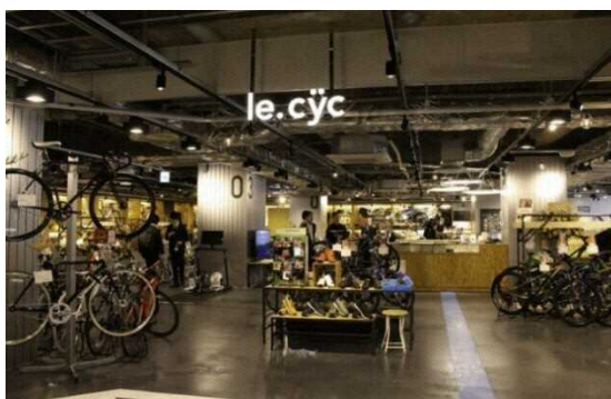
図 7.9 駅直結型のサイクリング拠点施設「りんりんスクエア土浦」(土浦市)