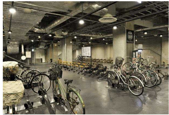
図 7.23 駅ビルの屋内駐輪場(土浦市)