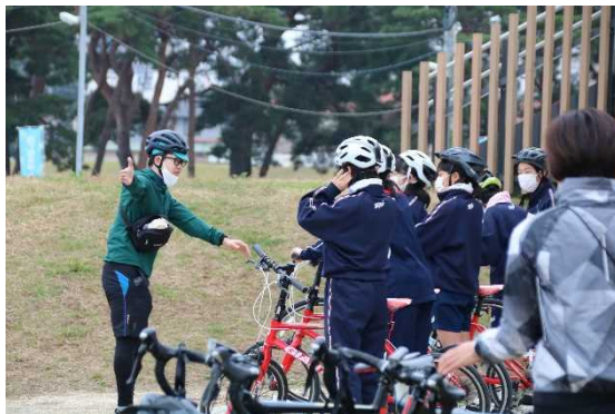
図 7.6 サイクリングを活用した校外学習