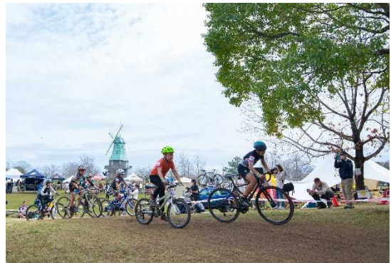
図 7.2 サイクリングイベント 土浦レイクサイドバイクロアの模様