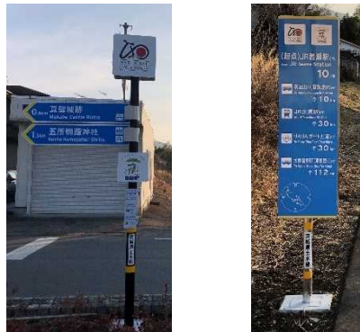
図 7.1 多言語とピクトグラムを使用したサインの例