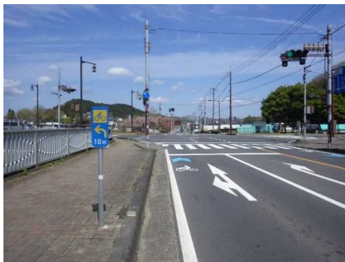
図 7.17 自転車通行空間 24) の整備