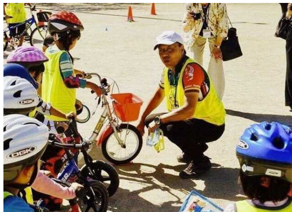
図 7.24 未就学児への安全教育