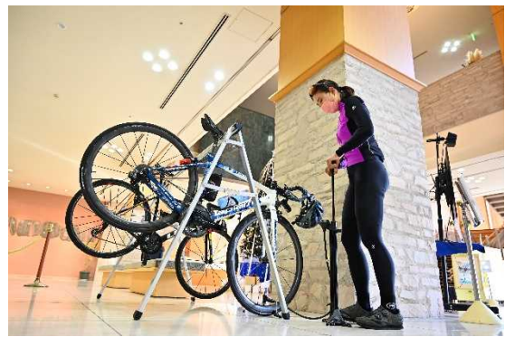
図 7.16 サイクリスト向けの機能を備えた 宿泊施設