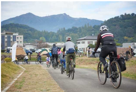
図 7.3 サイクリングイベント バイク&キャンプフェスの模様