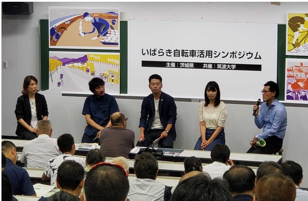
図 7.31 自転車利用促進イベント(いばらき自転車活用シンポジウム)