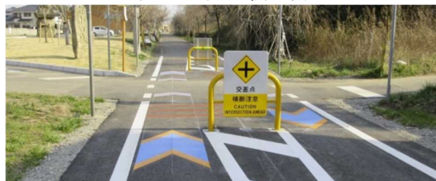
図 7.20 矢羽根・交通安全施設の例(つくば霞ヶ浦りんりんロード)