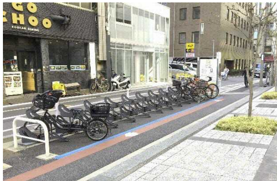
図 7.22 まちなかにおける路上駐輪場の例(東京都)