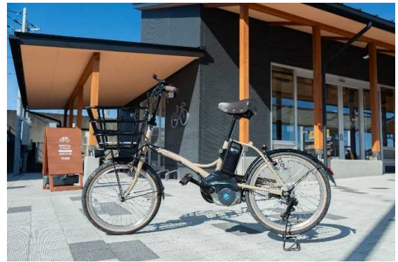
図 7.12 うみまちテラス(大洗町)