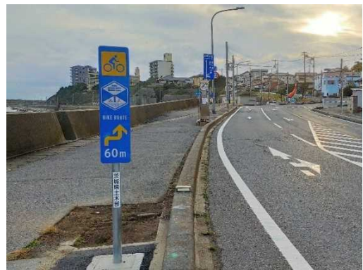
図 7.18 モデルルート 42) における標識の整備