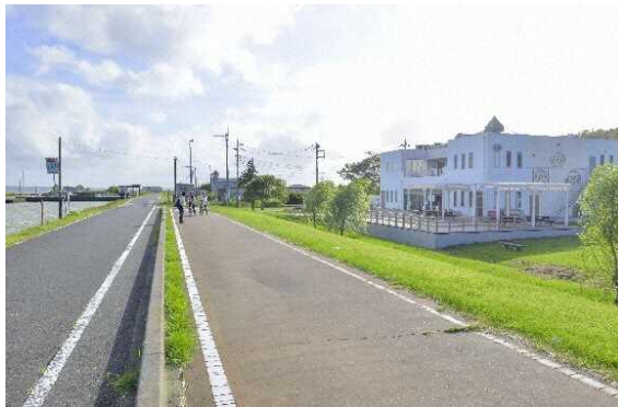
図 7.15 休憩施設 (かすみがうら市交流センター)