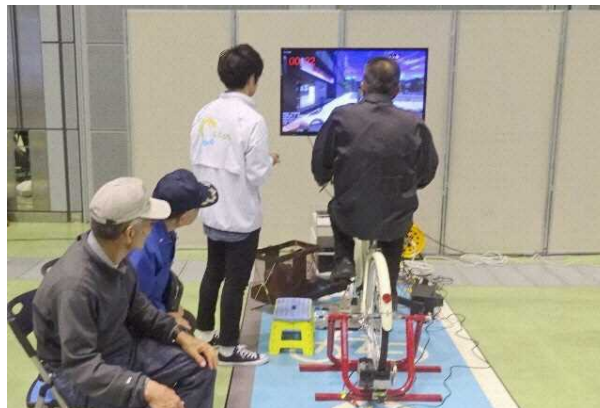
図 7.25 自転車シミュレーターによる安全教育の例