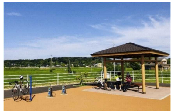
図 7.14 ポケットパーク 41) (行方市)