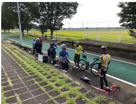
図 7.13 いばらきサポートライダー 1)