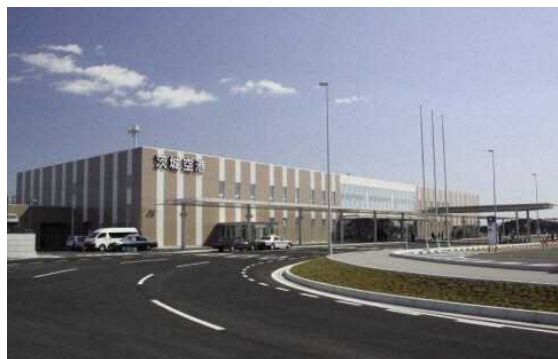
図 7.10 茨城空港(小美玉市)