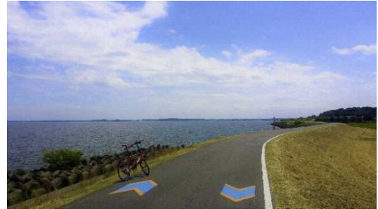
図 7.5 つくば霞ヶ浦りんりんロード