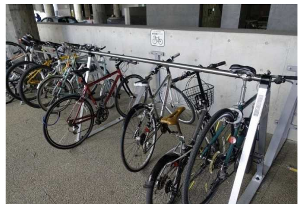
図 7.30 茨城県庁舎の駐輪場