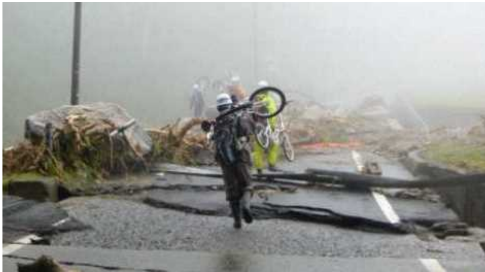
図 7.28 災害時における機動性の高い自転車の活用の例