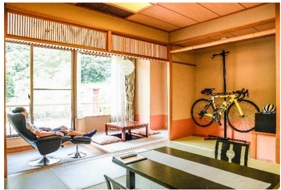
図 7.4 サイクリストにやさしい宿認定施設