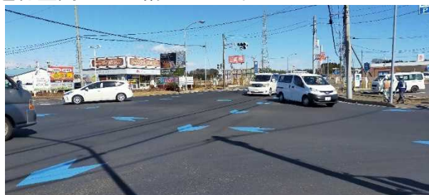
図 7.19 矢羽根の例