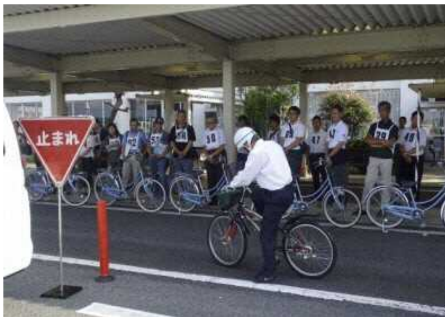
図 7.27 安全指導者講習会