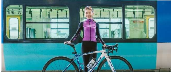
図 7.11 JR 水郡線サイクルトレイン 14)